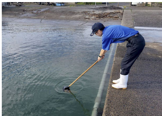
当館飼育員による採集の様子